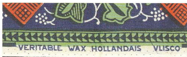
Onder: Kwaliteits- en echtheidskeurmerk Vlisco-stof