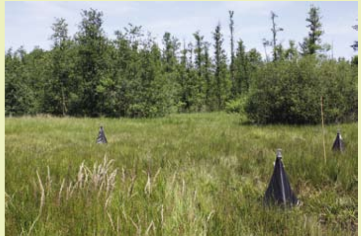
Insectenmonitoring, Zwarte beek