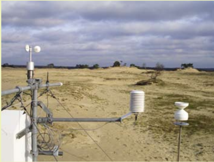
Stuifzandonderzoek op Kootwijkerzand