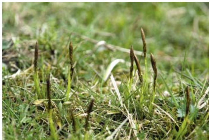
Carex preacox, Vreugderijkerwaard