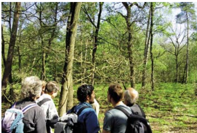
De Expertisegroep fauna hield op 2 juni 2010 een kennisexcursie naar het Edesche Bosch. Deze excursie stond in het kader van de effecten van micronutriënten in de bodem op de fauna.

In 2010 heeft de expertisegroep fauna een interne evaluatie uitgevoerd over het functioneren van de groep. Daaruit bleek dat de groep inmiddels is betrokken bij de begeleiding van het merendeel van de O+BN projecten. Omdat de onderzoekagenda nu al in januari en februari begint terwijl pas in september de definitieve onderzoekvoorstellen klaar zijn, is er voortaan ruimschoots tijd om nieuwe voorstellen in de expertisegroep te bespreken. Omdat inmiddels een grote hoeveelheid kennis is ontwikkeld over het beheer van fauna, is het plan opgevat om in 2011 onder de terreinbeheerders een evaluatie uit te voeren om te zien hoe O+BN kennis wordt toegepast in het veld.