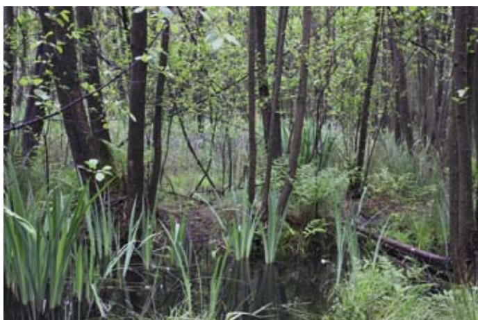
Herstel elzenbroekbos, Lankheet

* in samenwerking met Deskundigenteam Nat zandlandschap