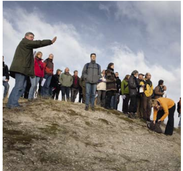
Tijdens de veldwerkplaats

In de Nederlandse duin- en kustlandschappen is sprake van veroudering en verstarring, waardoor kwaliteit en voorkomen van kenmerkende habitattypen en beschermde soorten in het geding zijn. Zandsuppletie zou die veroudering en verstarring kunnen doorbreken en op termijn natuurlijker situaties kunnen opleveren. Ook lijkt zandsuppletie in combinatie met dynamisch kustbeheer te verkiezen boven de aanleg van zware, statische zanddijken. Wel heeft het suppletiezand soms een teveel aan kalk en nutriënten. Anderzijds kan dit kalk de ontkalking van de duinen tegengaan. Met name voor de sterk bedreigde 'grijze duinen' leveren suppleties het voor instandhouding benodigde fijne kalkrijke zand.