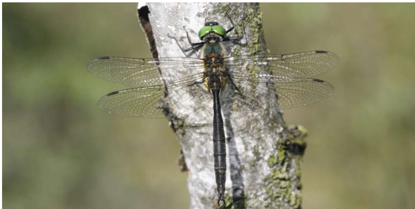
Hoogveenglanslibel in Wooldse veen