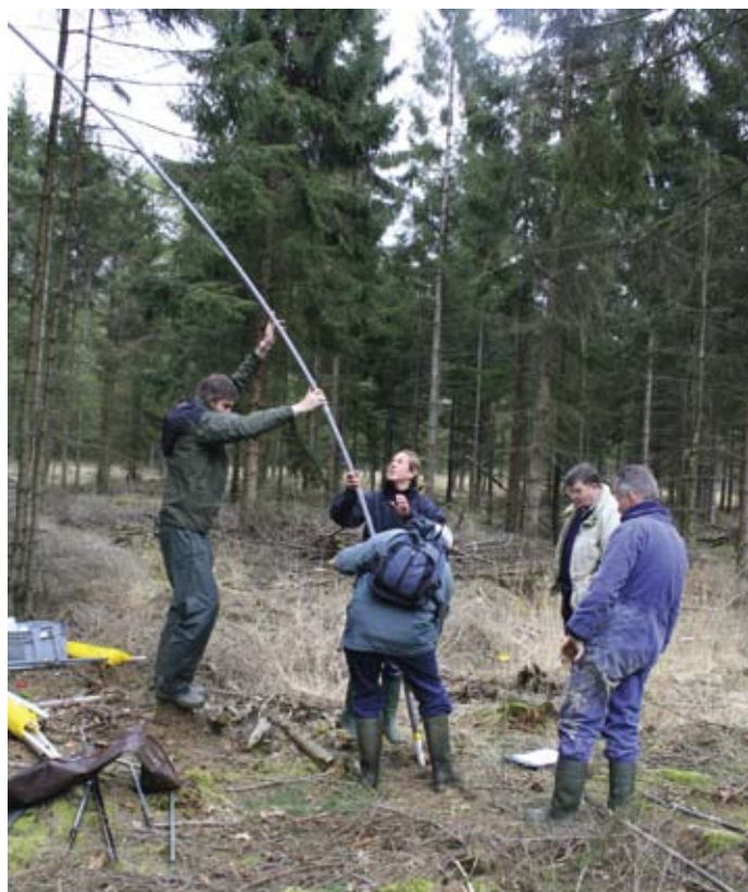
Grondboring bij het Barkmansveen, Dwingelderveld