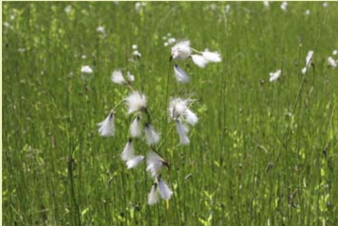
Breed wollegras, Lemselermaten