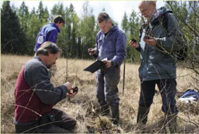
Veldwerk veenprofielen bij pingoruïne Gasselternveld